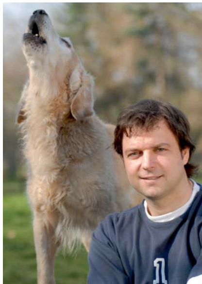
Medien-Multitalent und Hundetrainer Martin Rütter: „Die Trainingsmethoden der Tier-Nanny stammen aus dem Neandertal“.

Die rege Nachfrage nach Kursen in seinen inzwischen 30 lizenzierten Hundeschulen bundesweit und rund hundert Vorträgen pro Jahr führt Martin Rütter auch auf die Medien zurück. „Eine Hundeschule zu besuchen gehört inzwischen zum guten Ton – selbst Hundebesitzer mit Yorkshire-Terrier kommen ganz selbstverständlich in eine Welpenstunde, damit es gar nicht erst zu Problemen kommt.“ Doch an der Qualität von Erziehungssendungen im Fernsehen müsse unbedingt gearbeitet werden, findet Rütter. Wie das gehen kann, will er mit seiner neuen Sendung „Der Hundeprofi“ (ab Herbst samstags auf VOX) dokumentieren. Martin Rütter hat sich vertraglich zusichern lassen, dass mit zwei Kameras gedreht wird. Eine davon ist auf den menschlichen Akteur ausgerichtet, die andere hat immer den Hund im Blick, damit keine Szenen mit dem Tier nachgestellt werden müssen. Bei der Bearbeitung dürfen später keine launigen Kommentare aus dem Off über die Beiträge gelegt werden, die den Hundehalter diskreditieren. Und auch „gescheiterte Fälle“ bleiben im Programm: „In einer Folge rate ich den Menschen am Ende sogar, ihren bissigen Terriermischling abzugeben.“ Außerdem werden Rütters Fälle außerhalb des Fernsehens weiterbetreut – das ist leider keine Selbstverständlichkeit.