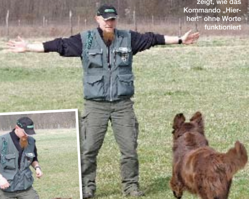
Der Hundetrainer zeigt, wie das Kommando „Hierher!“ ohne Worte funktioniert